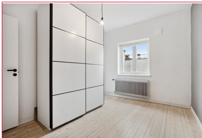
Stort soverom med skyvedørgarderobeskap og plass til en dobbeltseng.