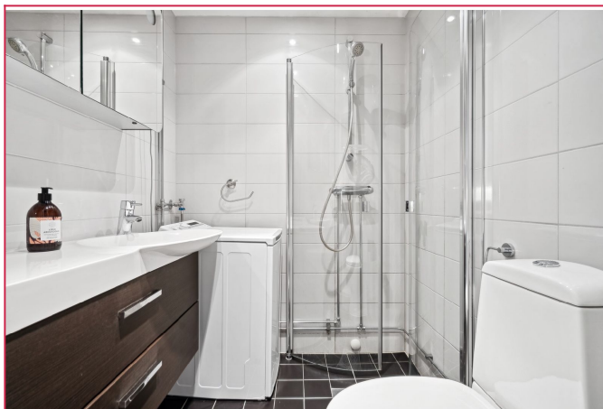
Flislagt bad med vaskemaskin og gulvvarme. Tilgang til fellesvaskeri.