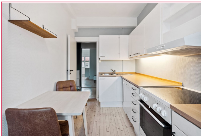
Separat kjøkken med alle hvitevarer inkludert. Rikelig med benke- og skaplass.