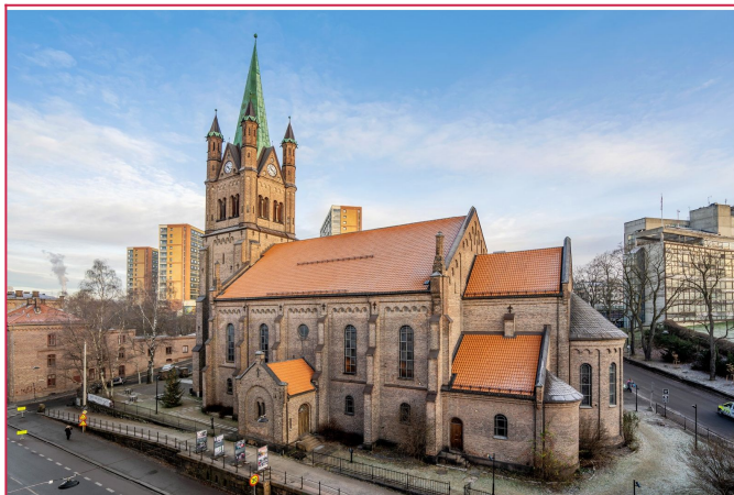
Fantastisk utsikt fra stuen over Grønland kirken.