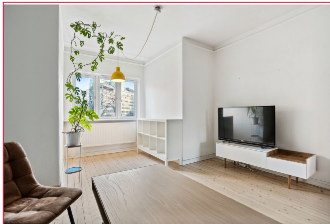
I leien er fyring, varmtvann og internett inkludert. Lave strømkostnader.