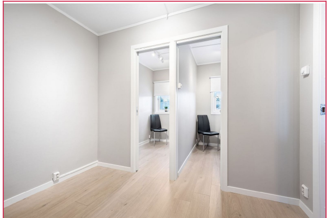
Soverom 2 - omgjort til to barnerom og lekerom.