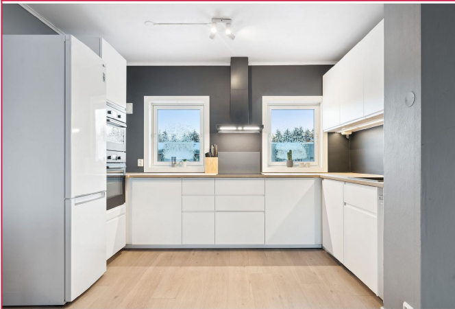
Kjøkken fra 2019, stilrent preg.