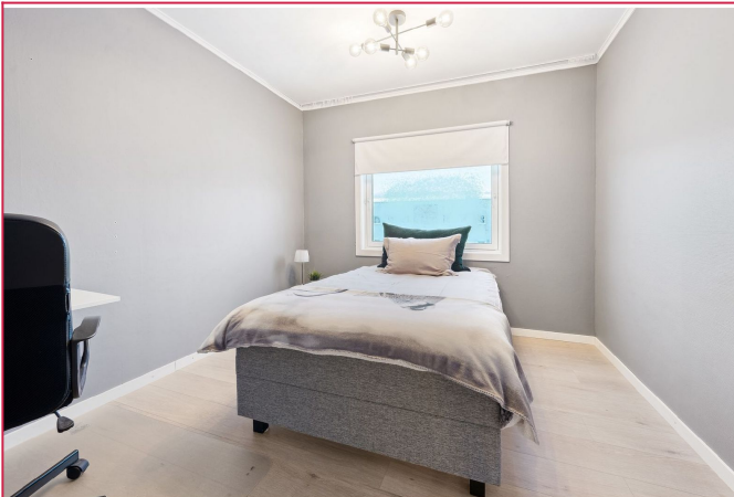
På hovedsoverrommet er det et stort skap installert, god plass til seng og møblement.