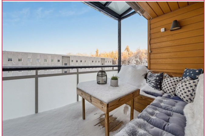
Stor balkong med utemøbler – husk å ta inn putene før de starter sin nye karriere som vinterdekor!