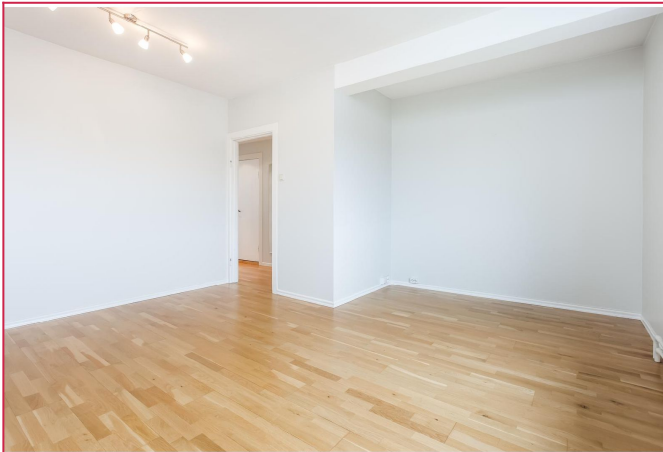
Stor stue med plass til spisebord