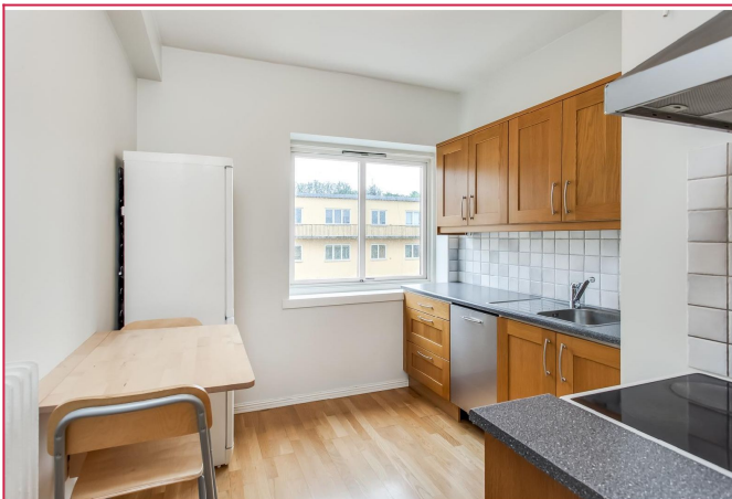
Flott kjøkken med plass til et lite kjøkkenbord