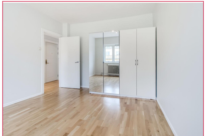
Soverom med garderobeskap