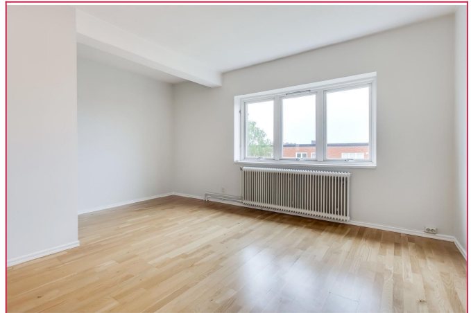
Stor stue med plass til en god sofakrok