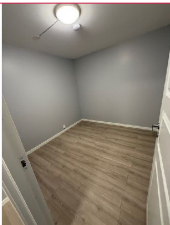
Disponibelt rom uten vindu