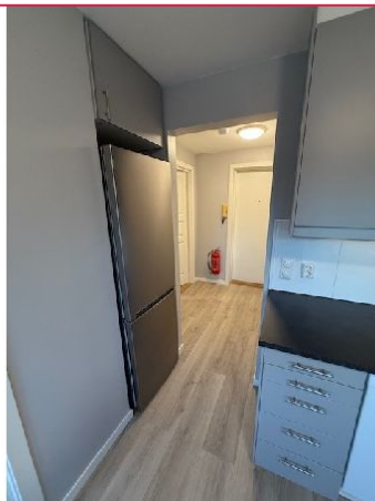
Kjøkken mot entré