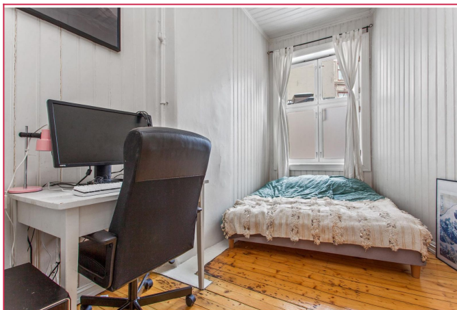
Stort soverom inn mot bakgården