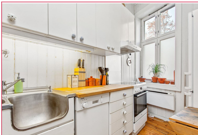
Separat kjøkken med hvitevarer.