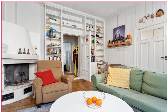
Hyggelig leilighet med peis og god takhøyde