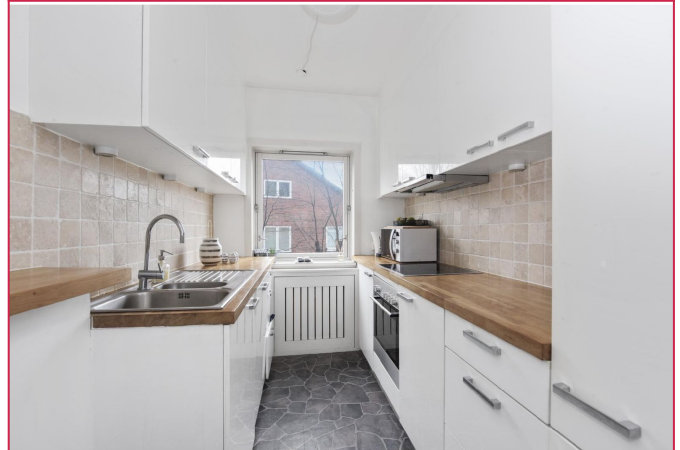
Kjøkkenet er godt tilpasset boligen med hensyn til utnyttelse og funksjonalitet.