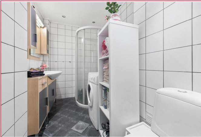
Romslig bad med varmekabler i gulv. Vaskemaskin medfølger.