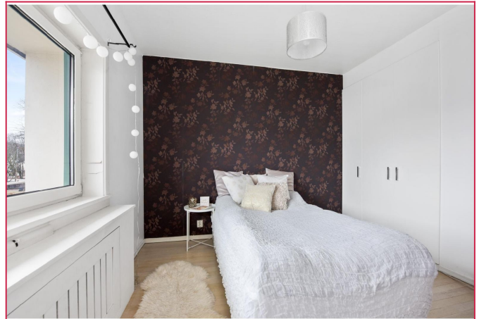
Leiligheten har totalt 3 soverom av god størrelse.