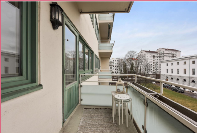
Fra stuen er det utgang til roslig balkong.