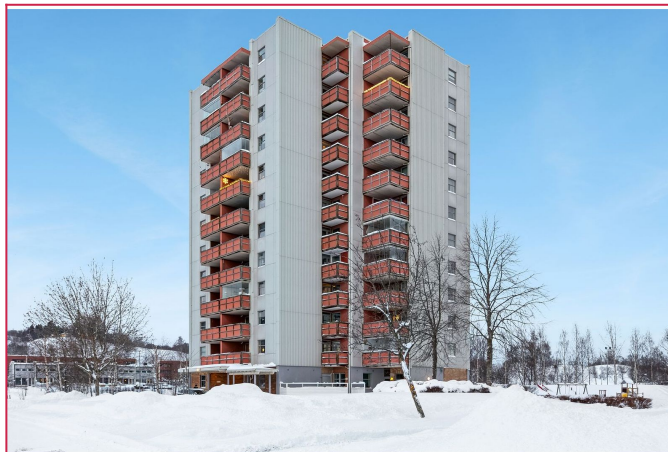
Fasade - stor oppstillingsplass for bil rett utenfor bygget