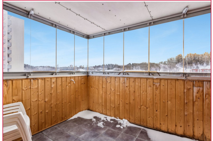
Vakker utsikt fra balkongen!