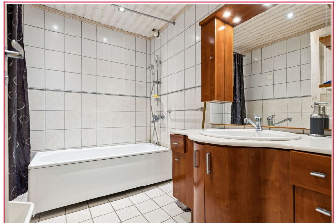
Bad med badekar