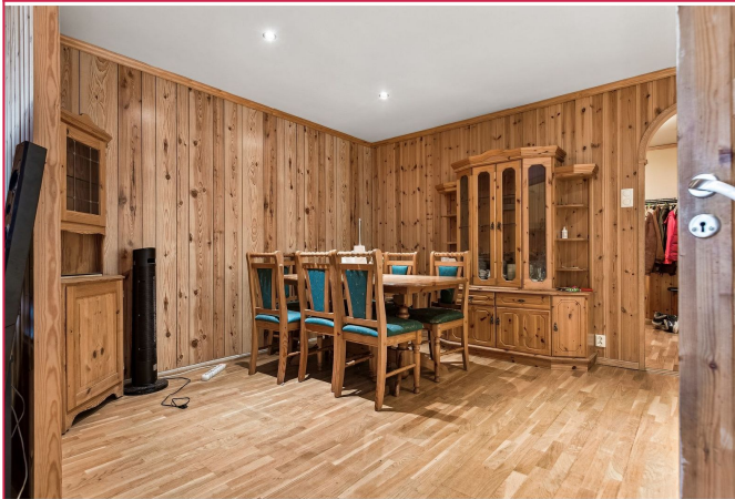
Stuen er stor, og er delt inn i med 2 sitte-seksjoner