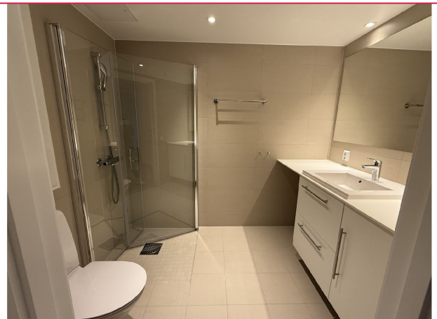
Hovedbaderom - Vaskemaskin blir montert og medfølger