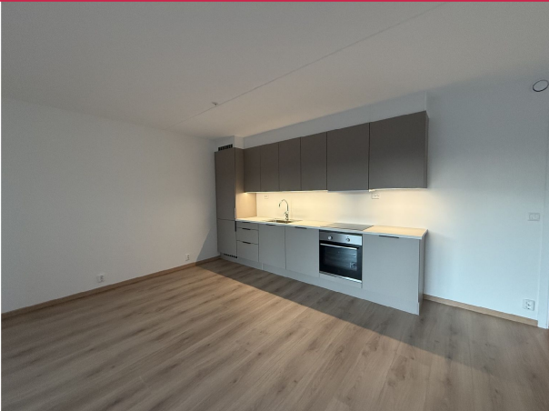
Pent kjøkken med integrerte hvitevarer og godt med skaplass