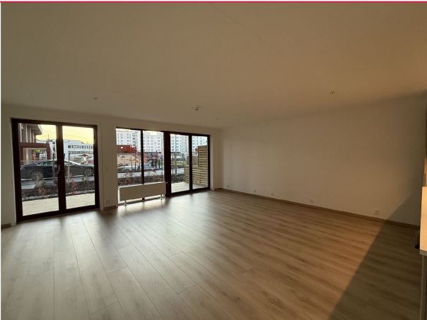
Stuen og spisestuen ligger i åpen løsning med kjøkkenet og er svært romslig