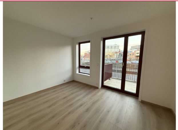
Soverom med tilgang til balkong - Det blir satt inn garderobeskap