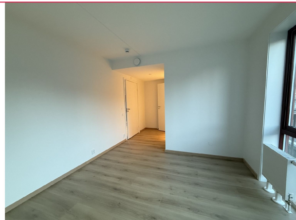
Soverom med eget badrom og balkong