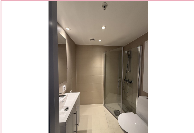
Baderom i tilknytning til soverommet