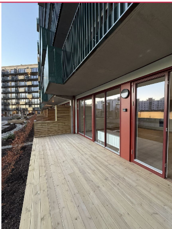
Fra stuen er det tilgang til en romslig, delvis overbygget markterasse