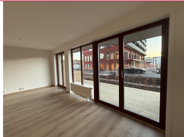
Her kan man fint møblere inn i ulike soner - Tilgang til markterasse