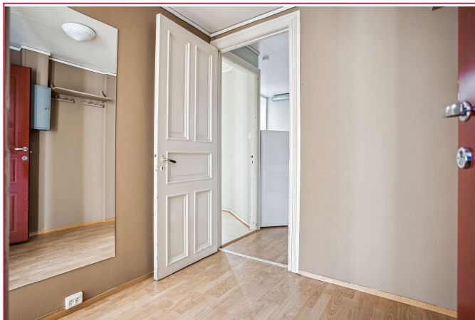
Romslig gang/ entre