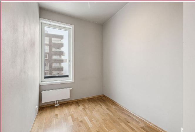
Soverom med skap som medfølger, samt direkte tilgang til en bod med gode oppbevaringsmuligheter.