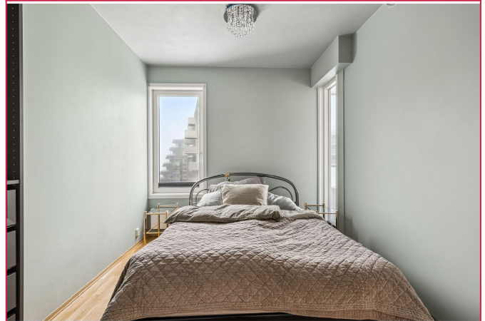
Hovedsoverom med seng, nattbord og garderobeløsning som medfølger.