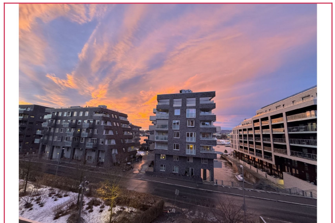
Utsikt fra en romslig, overbygd balkong med gode solforhold og møblement som medfølger.