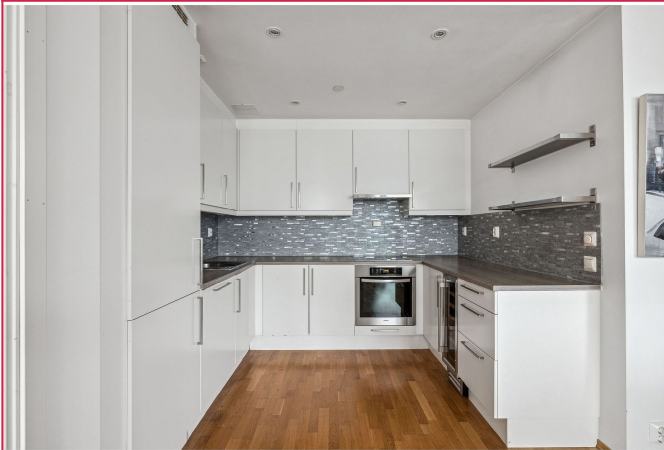
Praktisk, moderne kjøkken med integrerte hvitevarer.