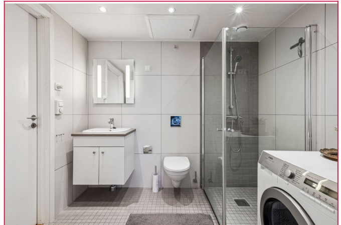
Flislagt bad med dusjhjørne og vaskemaskin som medfølger.