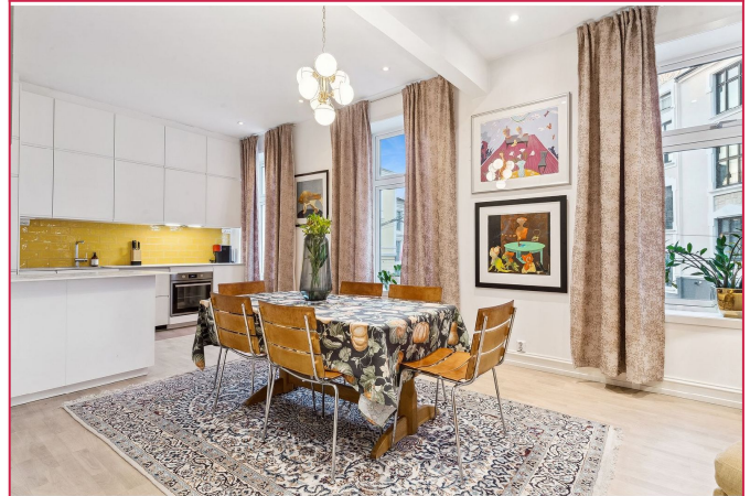
Kjøkken og romslig spiseplass