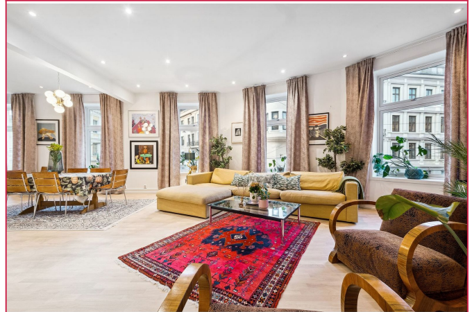
Meget romslig stue, mye vinduer og gode lysforhold