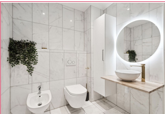
Romslig, delikat bad.