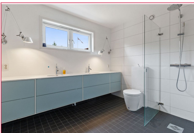
Flott bad med varmekabler i gulv, god benksplass og dusjvegg.