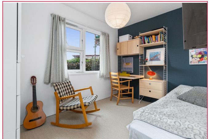
Soverom 4 har også garderobeskap og god plass til seng, skrivebord etc.