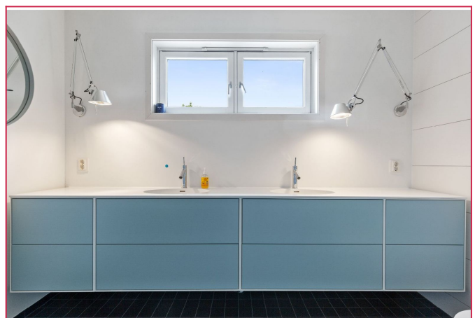
Dobbel servant og god oppbevaringsplass i servantskap på bad. Vindu som gir naturlig dagslys.