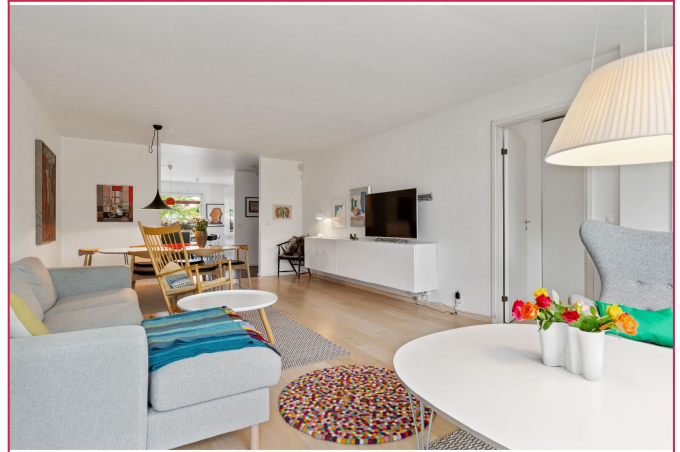
Gjennomgående leilighet med plass til både sofagruppe og spisebord. Veggmontert skjenk følger med.