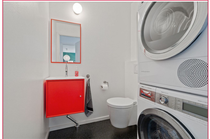
Separat gjestetoalett/vaskerom med opplegg til både vaskemaskin og tørketrommel.