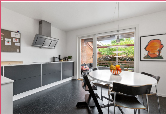
Flott, nyere kjøkken med plass til spisebord. Utgang til hyggelig terrasse fra kjøkken.