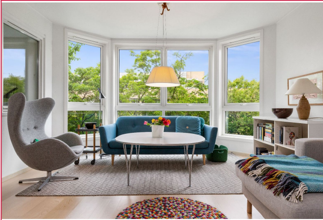
Svært gode lysforhold med store vinduer i stuen. Varmtvann, kabel-tv og Internett inkl. i husleien.