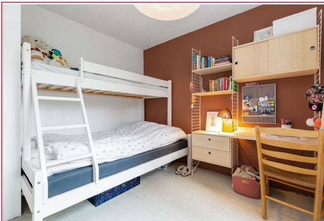
Soverom 3 har plass til seng i nisje.