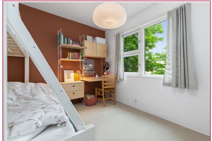
Romslig soverom 3 med plass til køyeseng og skrivebord.