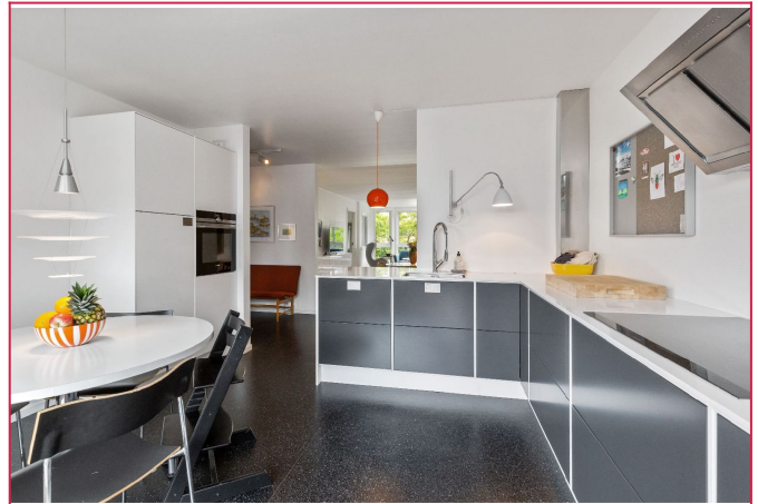
God skap- og benkplass på kjøkken og alle hvitevarer er integrert.