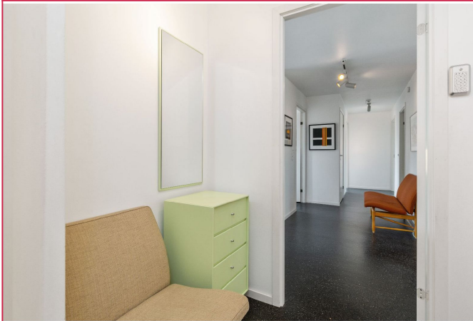
Ved entré er det en innvendig bod med god plass til yttertøy og sko, samt et stort frysenskap.