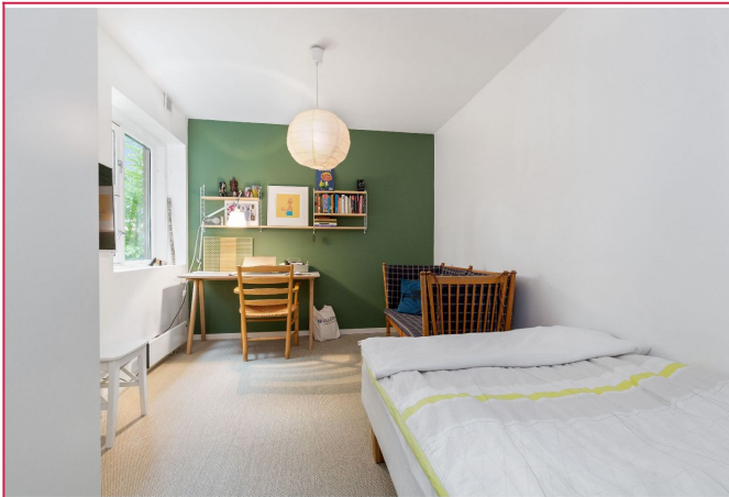
Soverom 2 med god plass til seng, kontorpult etc. Garderobeskap følger med.