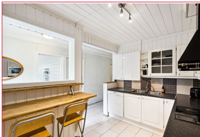
Stort og pent kjøkken med alle nødvendigheter