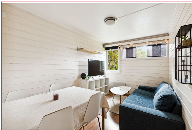
Kollektivet har også en hyggelig stue til sosiale sammenkomster - Her får du alt inkludert i leien