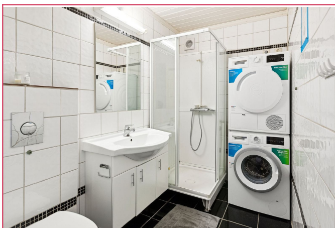
Boligen har 2 bad, der det ene også benyttes som vaskerom