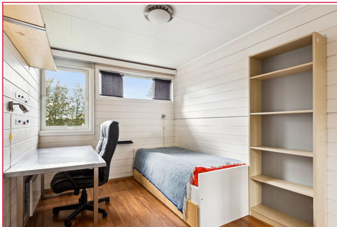
Rommene er av god størrelse, møblert med seng, skrivepult og garderobeskap