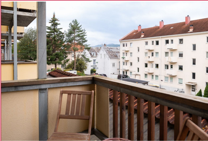
Balkong med utsikt