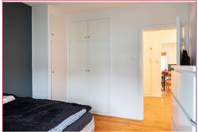
Innebygd garderobeskap på soverommet.