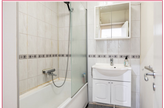
Flislagt bad med praktisk badekar.