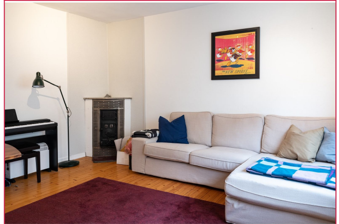
Lysmalt og trivelig stue, med flere møbleringsmuligheter