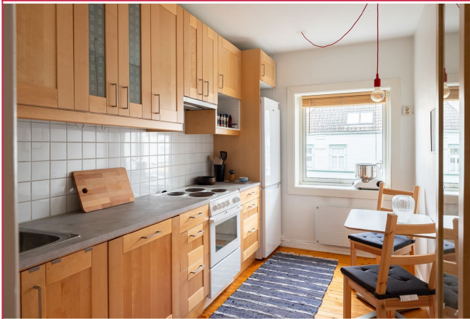
Kjøkken med spisebord