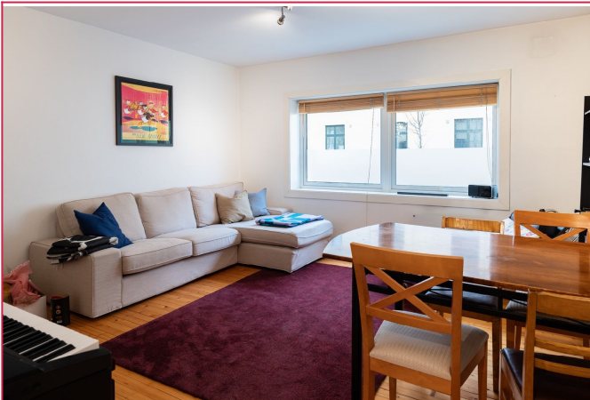
Internett medfølger i leieprisen.