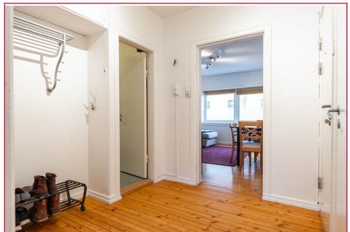
Leiligheten har gjennomgående sjarmerende tregulv.