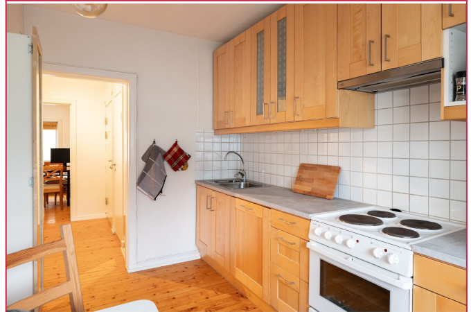
Kjøkken med integrerte hvitevarer