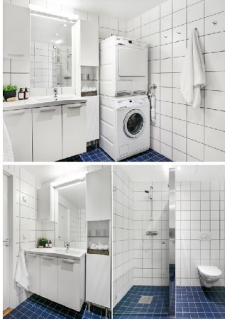
Baderom med plass til hvitevarer -