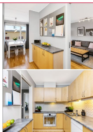
Kjøkken er delvis separat