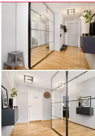
Stor entre med dobbeltgarderobe - ledig fra 02.mai.2019