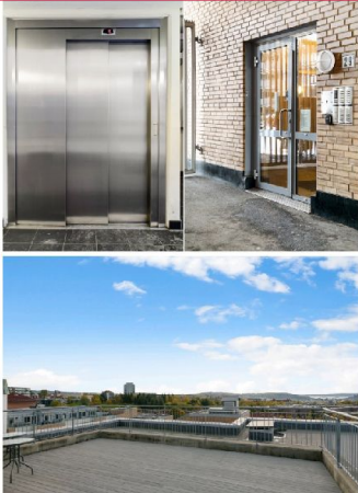
Det er felles takterrasse og heis