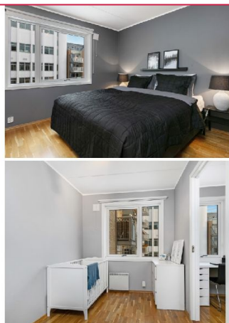
Soverom 1 og 2 - Soverom 1, med stor walk in / kontor