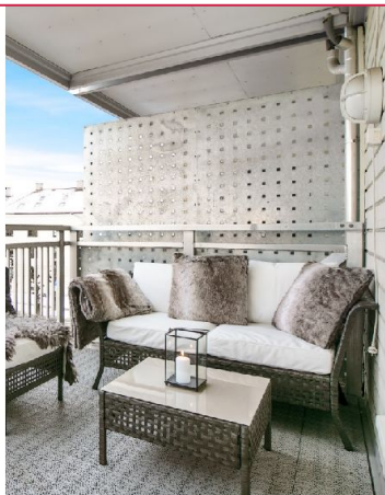
Balkong med god plass