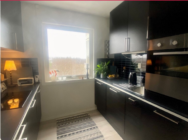
Pent kjøkken med mye skap- og benkeplass.