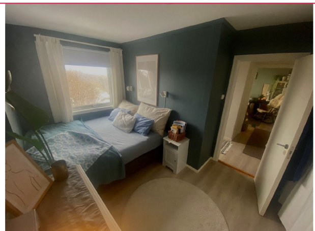
Det er etablert garderobeløsning på soverommet.