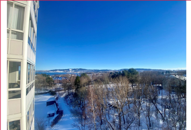
Utsikt fra balkong.