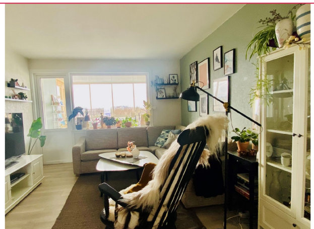
Kabel-TV/Internett er inkludert i husleien.