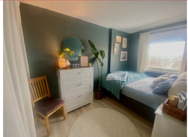
Romslig soverom malt i tidsriktige og behagelige farger.