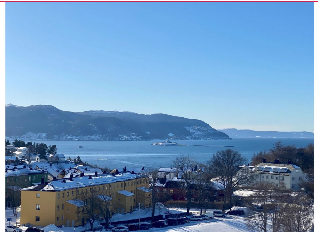
Utsikt fra balkong.