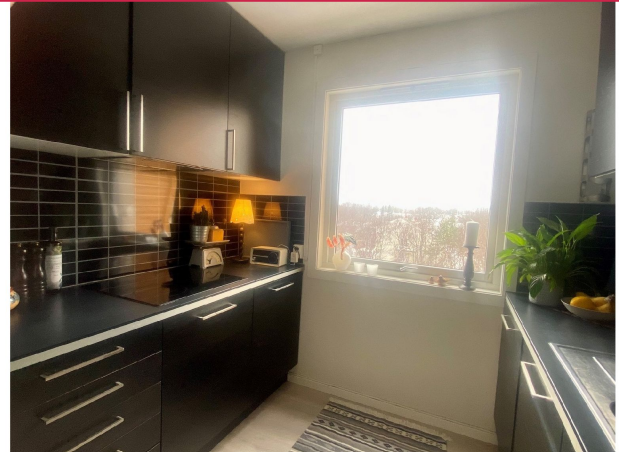
Kjøkkenet har integrerte hvitevarer som steketopp, stekeovn oppvaskmaskin og kombiskap.