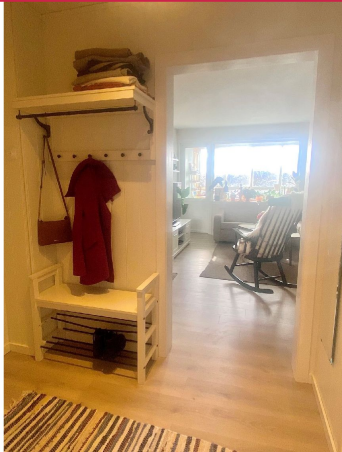
Gang/entrè med muligheter for oppheng og lagring av ytterklær e.l.