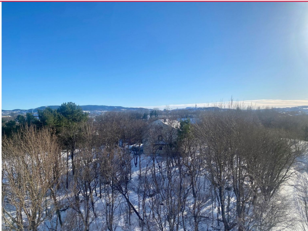
Utsikt fra balkong.