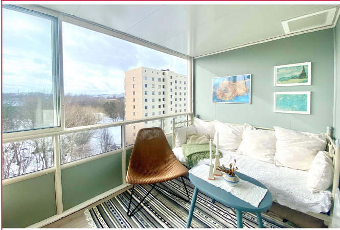
Fra stuen har man tilgang til en innglasset balkong med fantastisk utsikt.