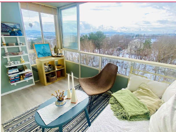
Balkongen har oppvarming og brukes som en forlengelse av stuen. Glassvinduene kan åpnes og lukkes.