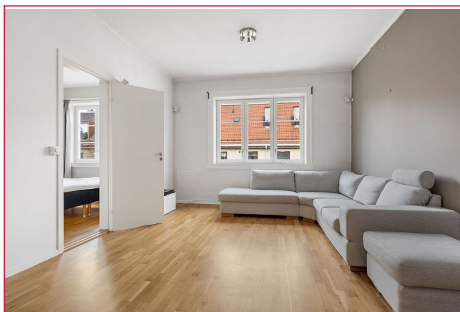
Romslig stue med god takhøyde