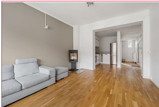
Stue med peisovn