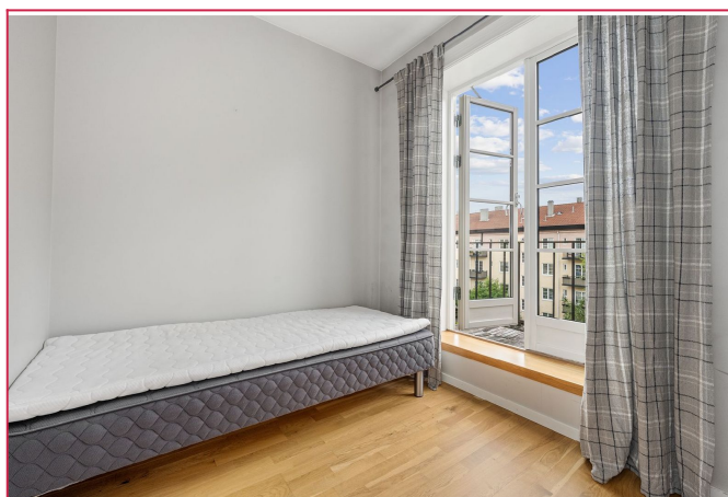
Soverom med utgang til balkong