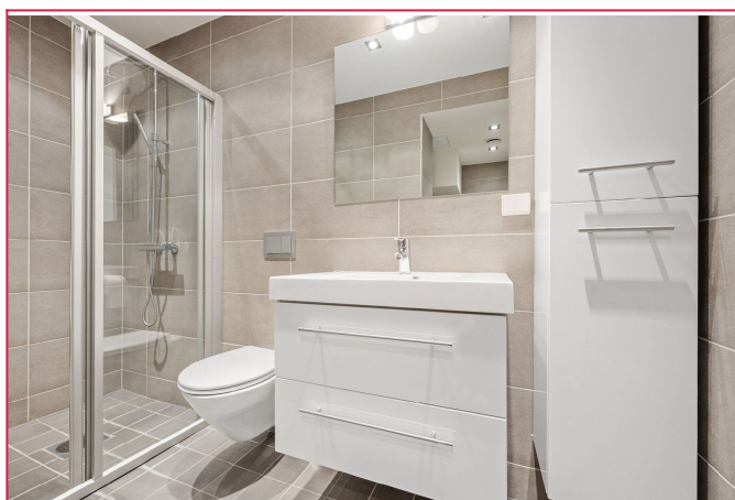
Delikat bad med opplegg for vaskemaskin