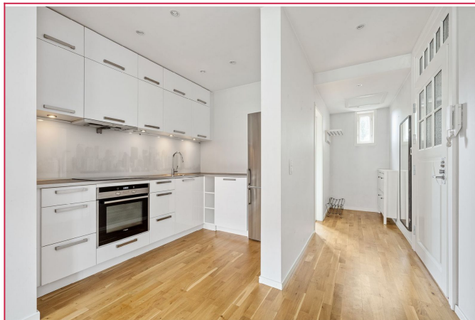
Kjøkken og entré