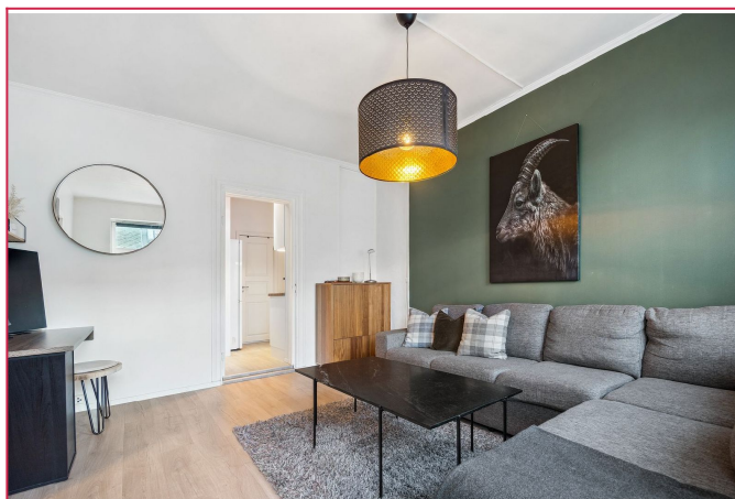
Her har man en praktisk planløsning med alle nødvendigheter fordelt på 33 kvrm.