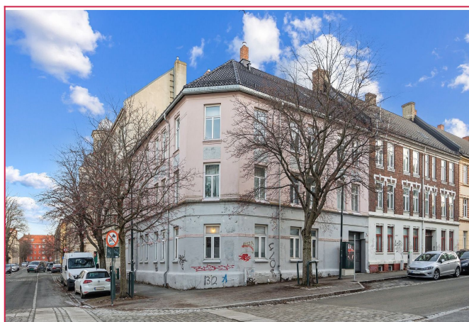
Det er gang- og sykkelavstand til Trondheim sentrum med alt av fasiliteter som byen har å by på.