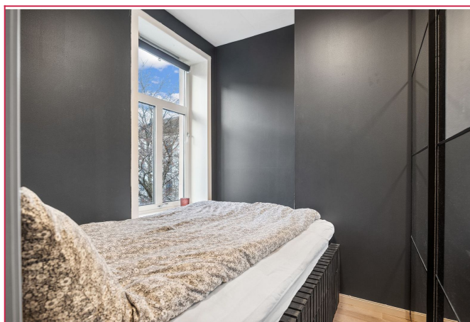
Soverommet er innredet med seng og stort garderobeskap. Soverommet har gode oppbevaringsmuligheter.