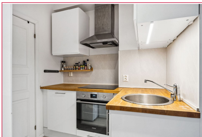
Lyst kjøkken med integrerte hvitevarer som platetopp, stekeovn og oppvaskmaskin.