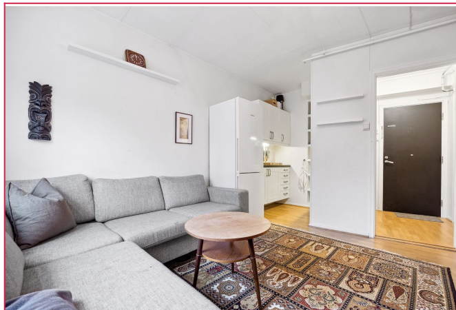
Leiligheten har en åpen løsning mellom stue og kjøkken på ca. 12 kvm.