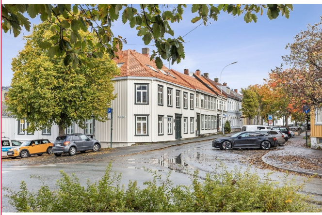
En lys 2-roms beliggende i en karakteristisk sentrumsgård.