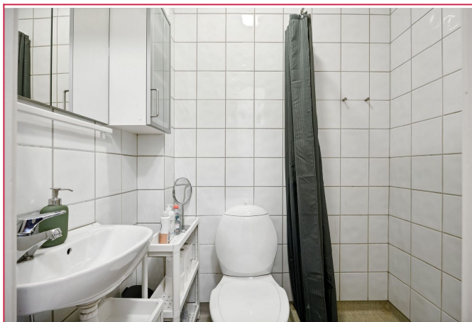
Badet er innredet med servant, toalett og dusjsone.