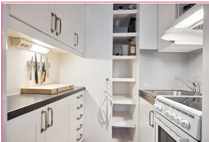
Lyst kjøkken med mye oppbevaringsplass.