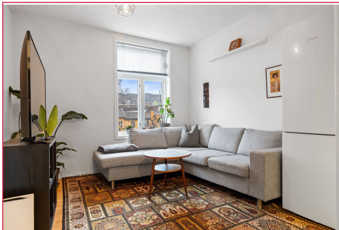
Her har man en praktisk planløsning med alle nødvendigheter fordelt på 25 kvm.