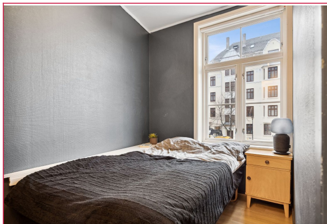
Soverommet er på 5,6 kvm med plass til dobbeltseng og tilhørende møblement.