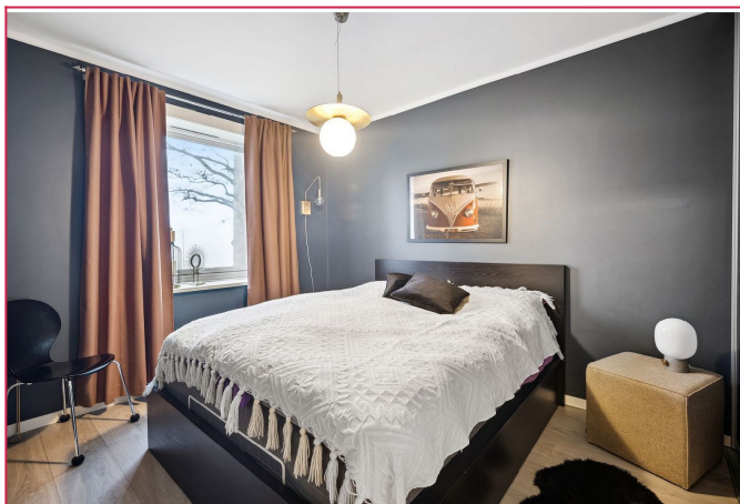
Romslig soverom med stor skyvedørgarderobe