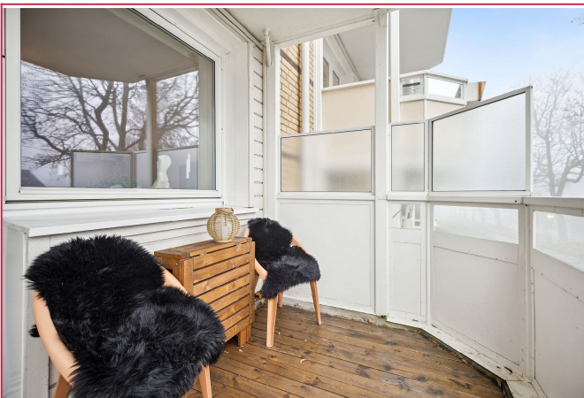
Hyggelig balkong med plass til utemøblement