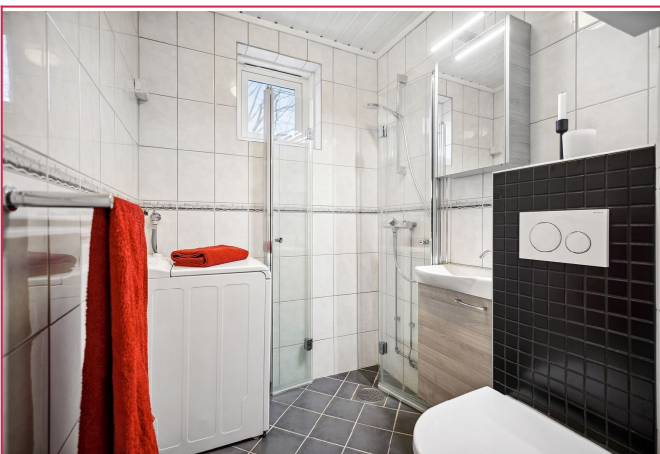
Pent flislagt bad med varmekabler. Vaskemaskin medfølger