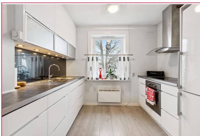
Lekker kjøkken med hvitevarer