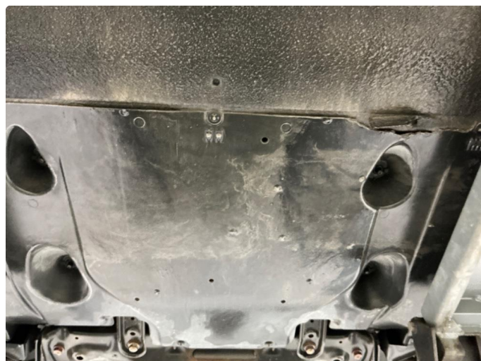
1.1 Liten skade på plate under batteri.