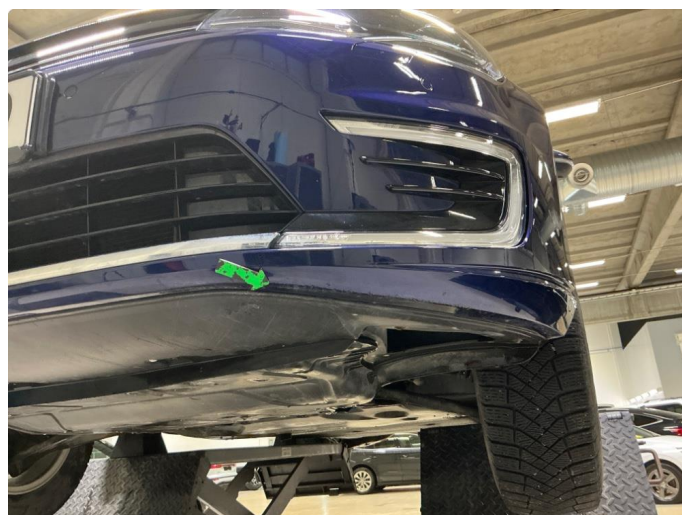
1.4 Riper underkant fanger foran.