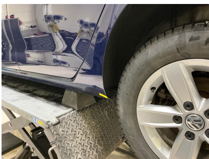
1.5 Rust bakre del på begge kanaler