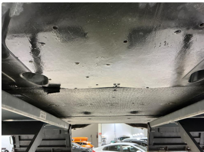
1.1 Liten skade på plate under batteri.