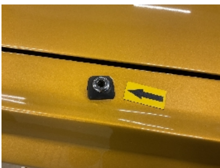
22. Radio / Multimedia