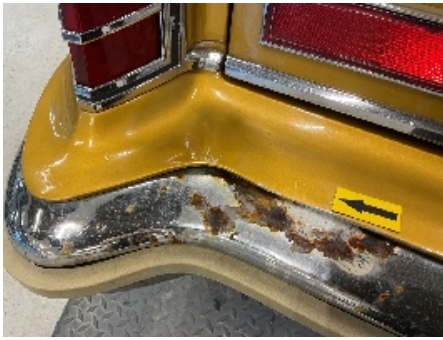
25. Lakk / karosseri utvendig