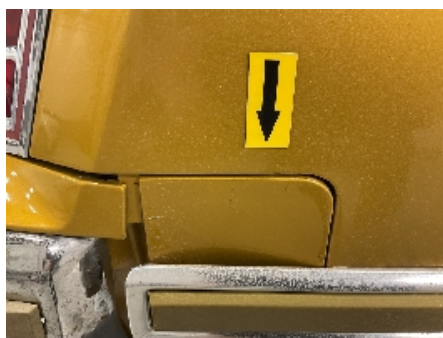
23. Lakk / karosseri utvendig