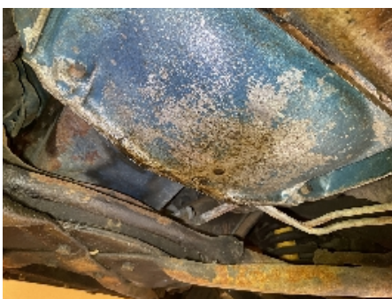
34. Utvendig tilstand motor