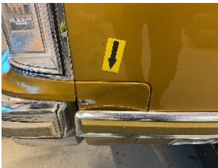
28. Lakk / karosseri utvendig