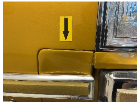
21. Lakk / karosseri utvendig