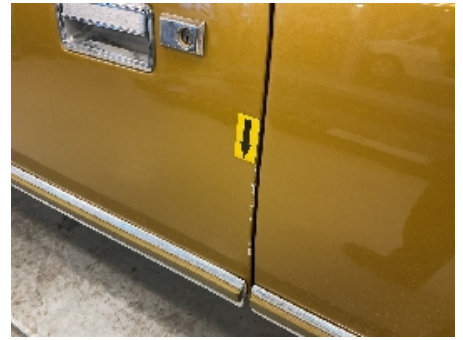
27. Lakk / karosseri utvendig