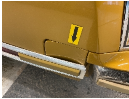
26. Lakk / karosseri utvendig