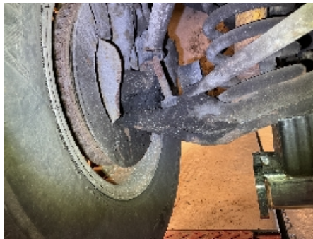
41. Opphings- / bærearmer foraksel