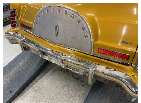
24. Lakk / karosseri utvendig