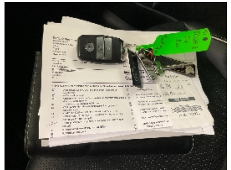
18. Nøkler / Utstyr