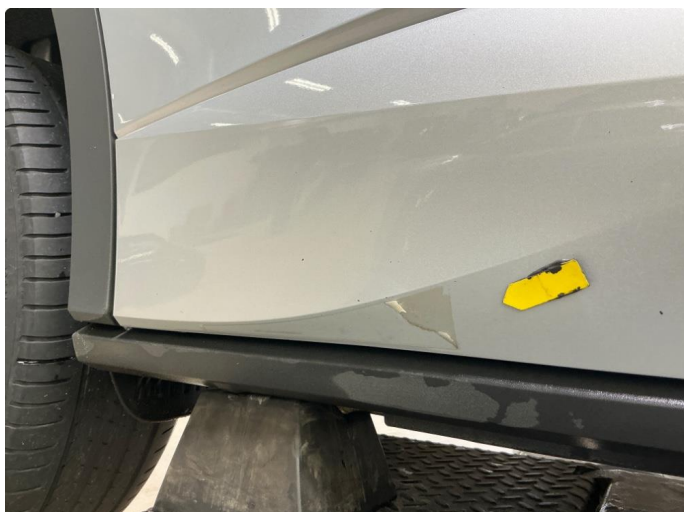
1.1 Liten skade på folie nedkant/bakkant av høyre bakkjør