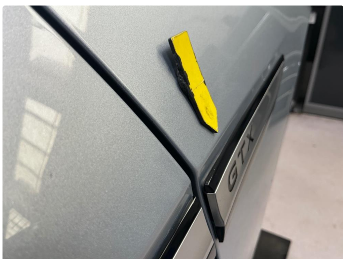
1.2 GTX emblemer forskjerner løse