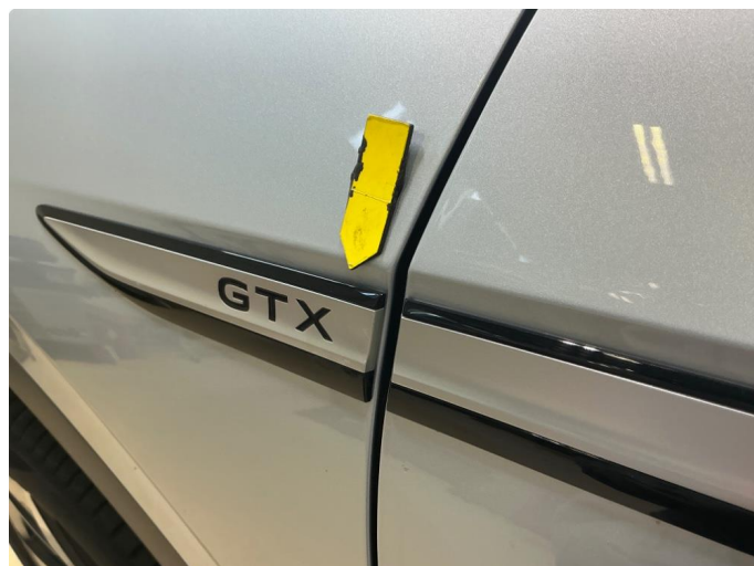
1.2 GTX emblemer forskjerner løse