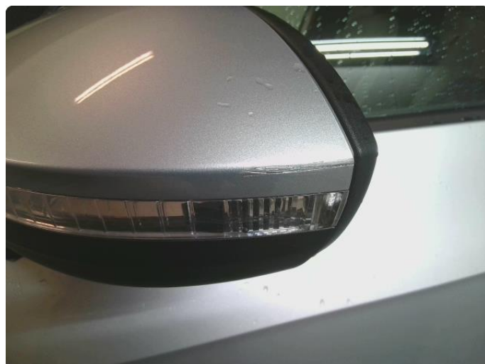
1.3 Speilhus riper