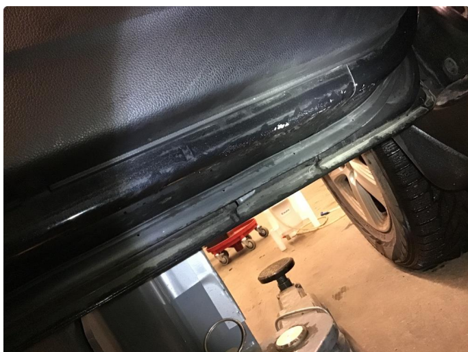
1.2 Lakk flasser