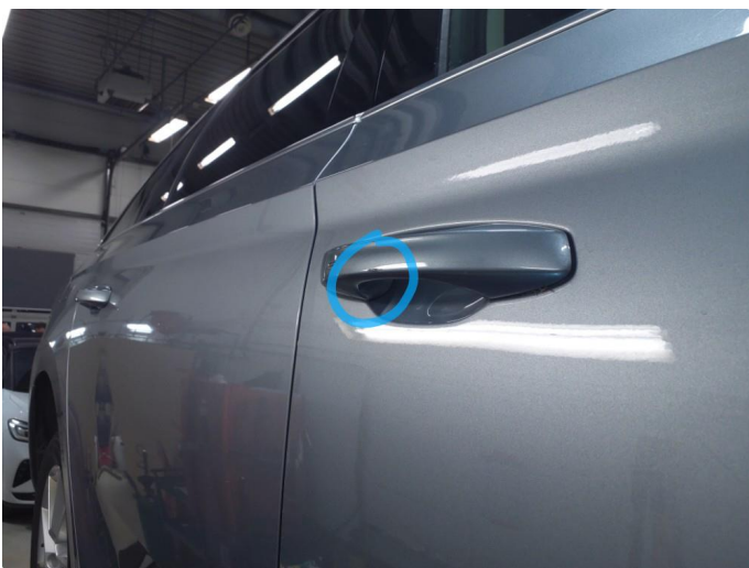
1.2 Håndtak defekt/skadet