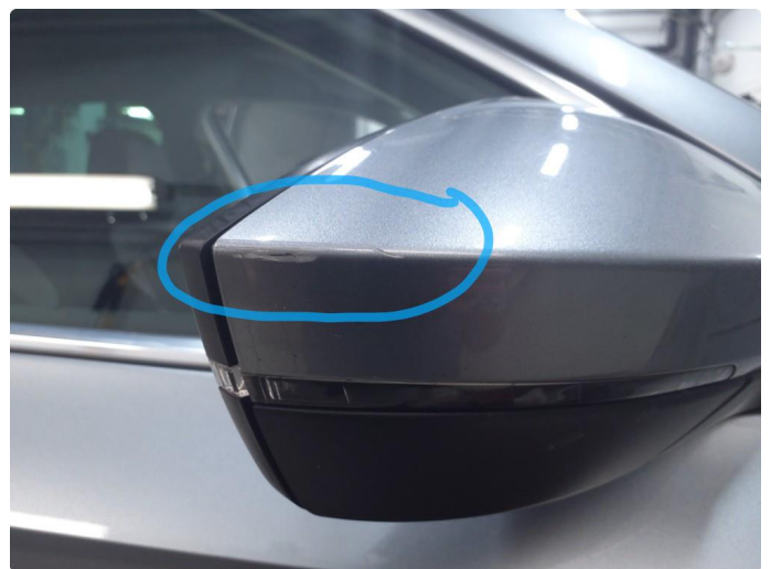
1.3 Deksel skadet/ripe