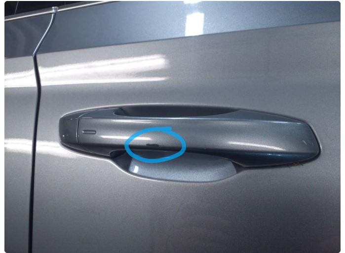
1.2 Håndtak defekt/skadet