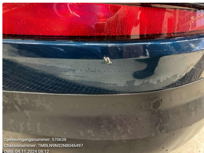
1.3 Ripe - penslet