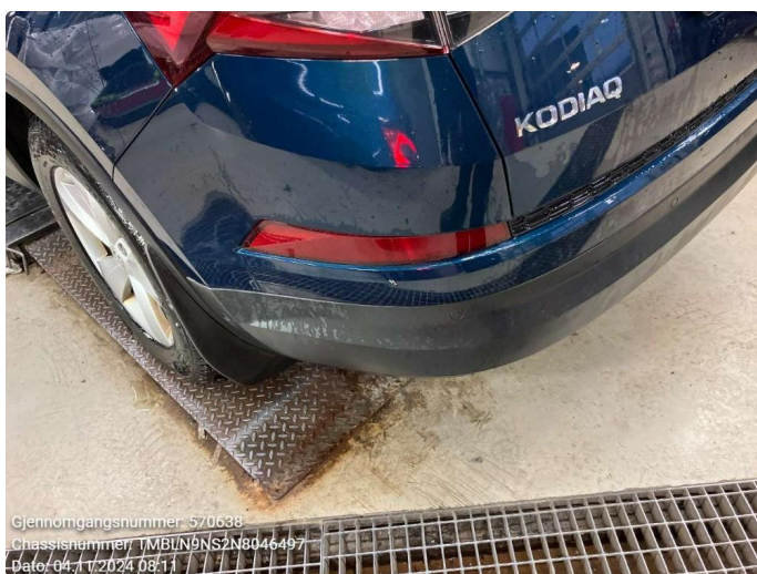
1.3 Ripe - penslet