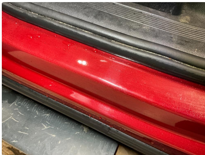
1.7 Slitte innsteg