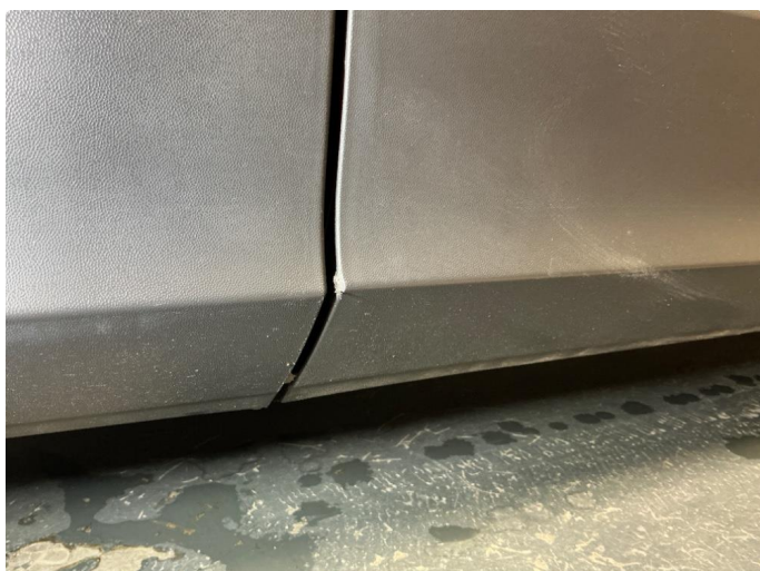
1.3 Høyre dør - lakksår nedre plastlist .