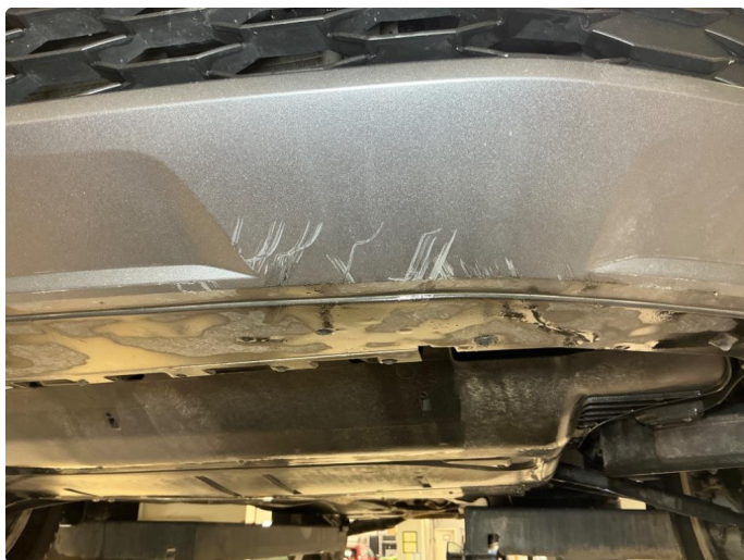
1.9 Støtfanger foran , skrubbskader underkant