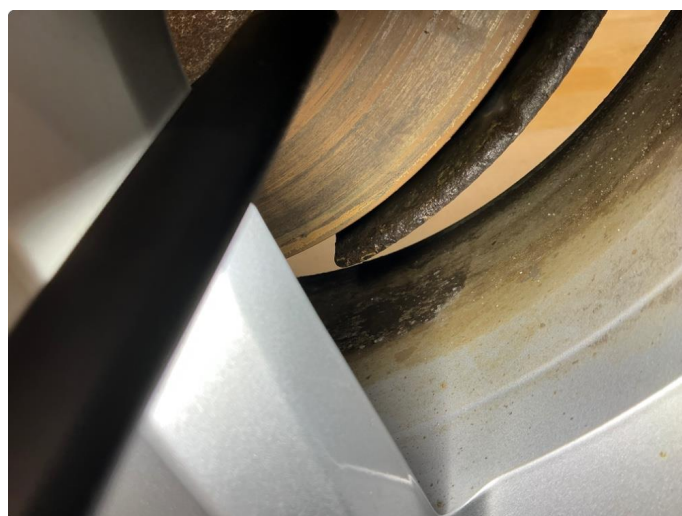
1.6 Korrosjon på alle vinterfelger