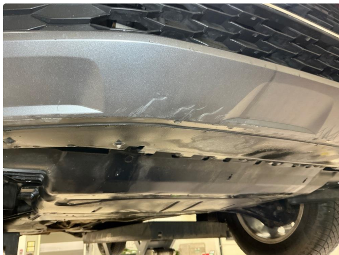
1.9 Støtfanger foran , skrubbskader underkant