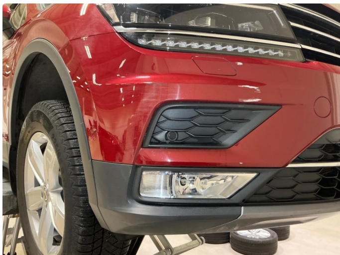
1.8 Støtfanger foran høyre side- liten skade