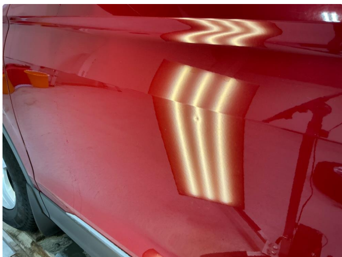
1.1 P-bulk Venstre fordør