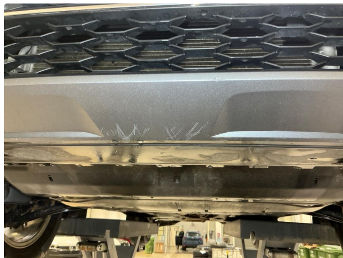
1.9 Støtfanger foran , skrubbskader underkant