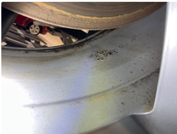
1.6 Korrosjon på alle vinterfelger