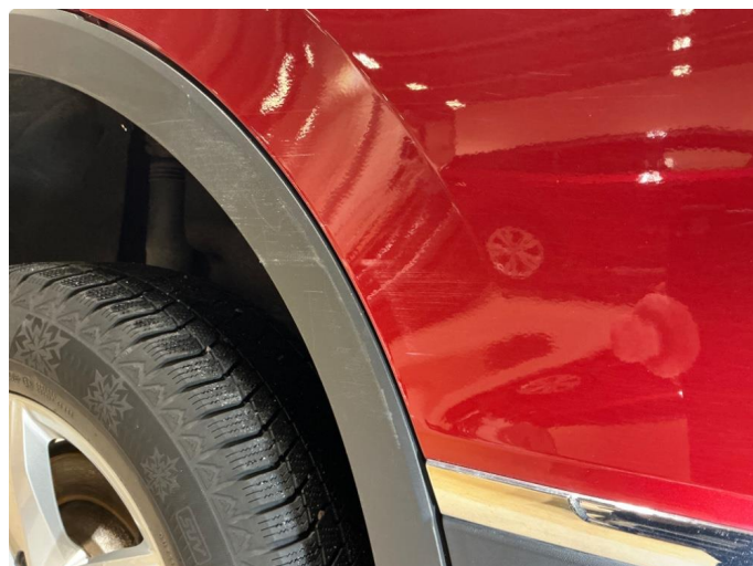
1.2 Høyre bakdør - riper/skrape