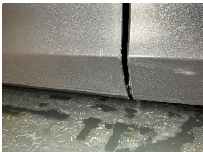
1.4 Venstre dør - lakksår nedre plastlist