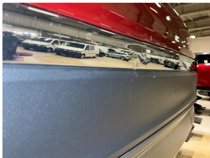
1.10 Bakfanger - kromlist bulket -