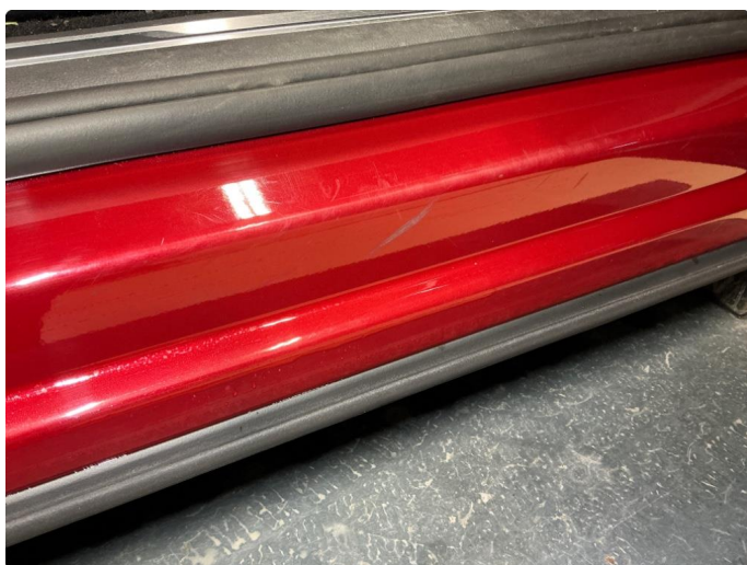
1.7 Slitte innsteg