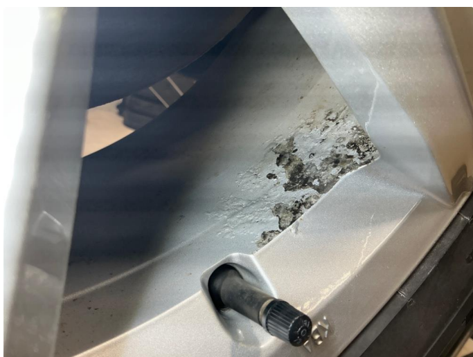
1.6 Korrosjon på alle vinterfelger