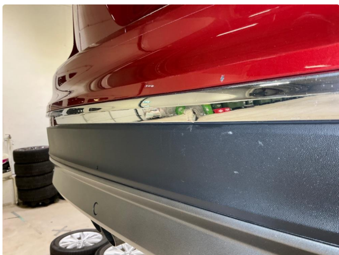
1.10 Bakfanger - kromlist bulket -