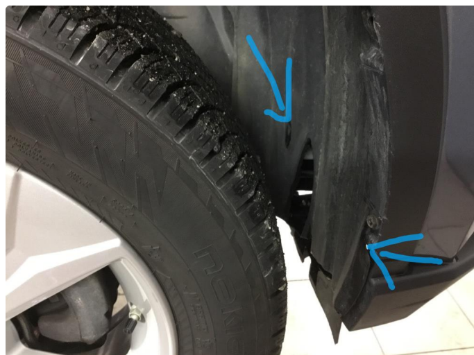
1.1 Plastinnerskjerm skadet