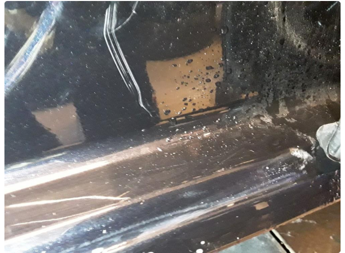
1.3 Noe riper.