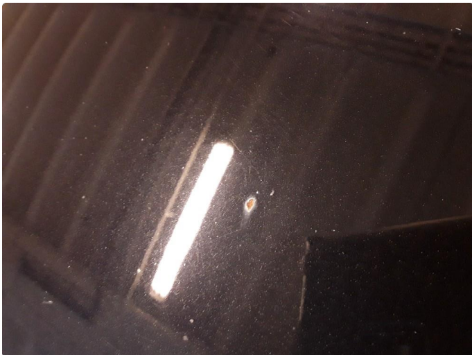
1.4 Steinsprut med korrosjon.