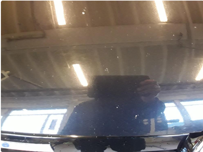
1.2 Noe steinsprut.