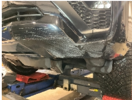
2. Lakk / karosseri utvendig