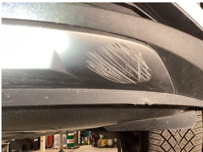
1.1 Skrubbskader underkant