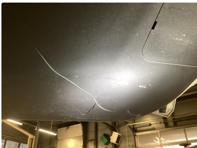
2.1 Skadet/merker etter utstyr