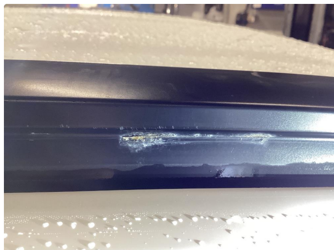
1.2 Øvrige feil