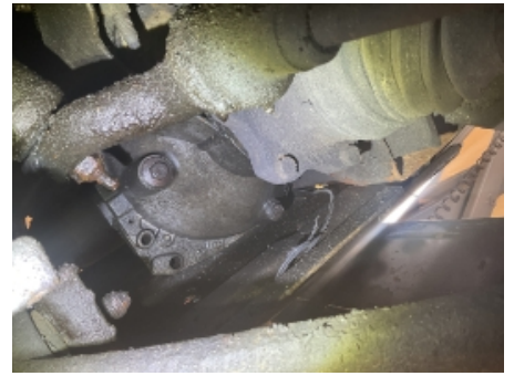
39. Utvendig tilstand motor