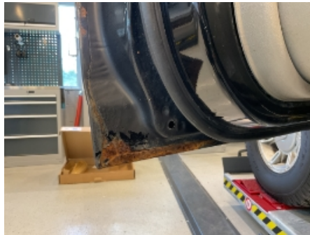
20. Lakk / karosseri utvendig