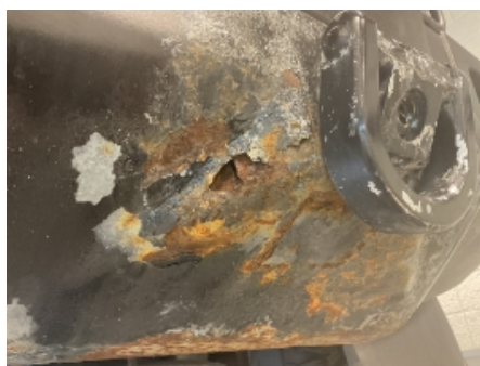
35. Lakk / karosseri utvendig