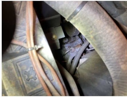
14. Utvendig tilstand motor