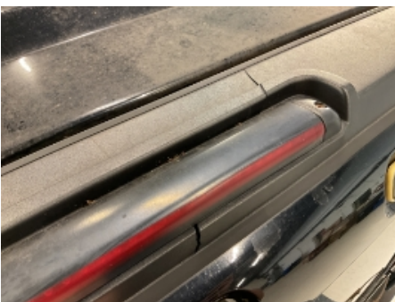
22. Lakk / karosseri utvendig