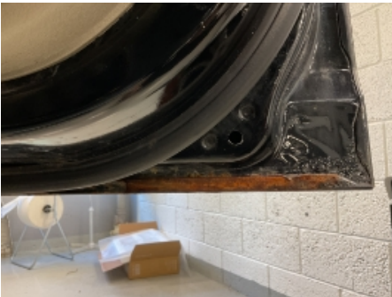
19. Lakk / karosseri utvendig