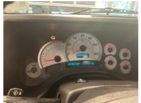
42. Varsellamper utvidet