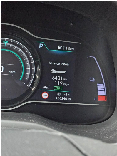
2.1 Bilen leveres med kommende service utført, OK