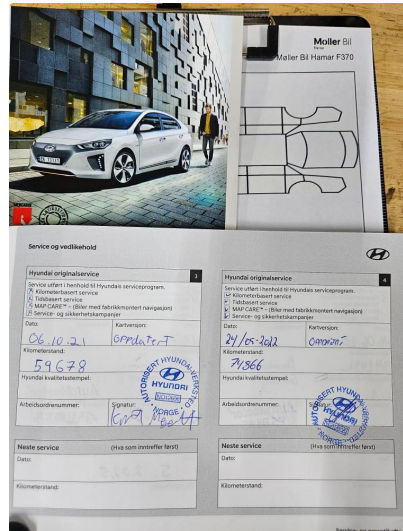
3.1 Dokumentert service, se bilde