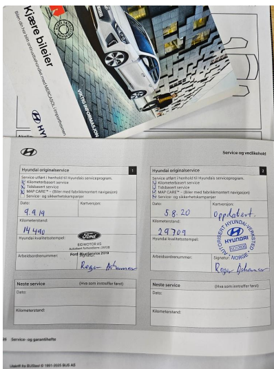
3.1 Dokumentert service, se bilde