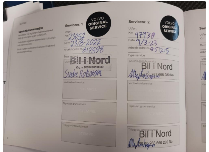
3.1 Dokumentert service, se bilde