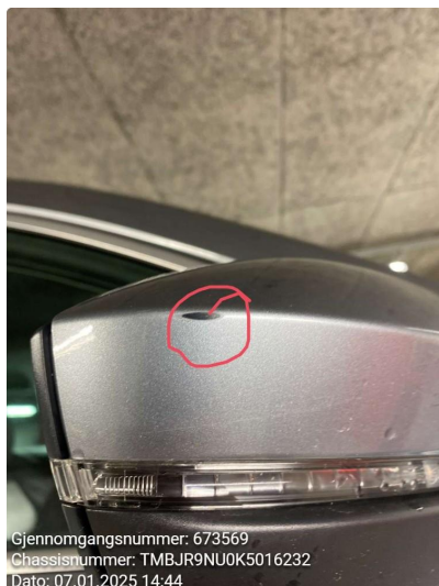
1.1 Speilhus riper