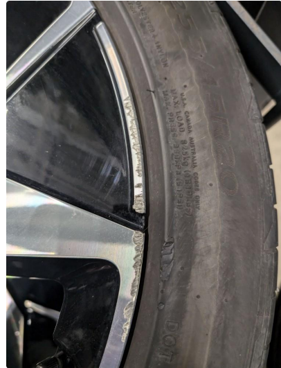
1.2 Noen sår/hakk/merker på 1 stk alu. sommerfelg, bakhjul