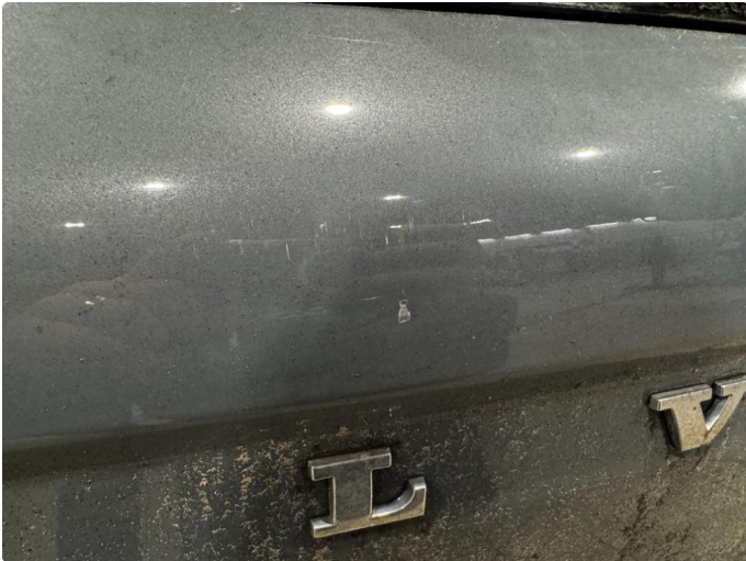
1.1 Liten lakk skade