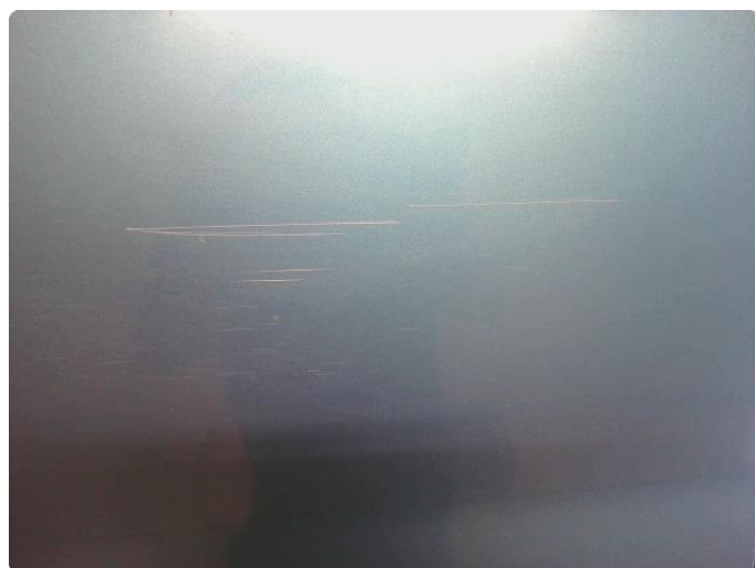
1.3 Ripe ned til grunning