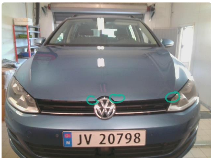
1.1 Noe steinsprut med rust