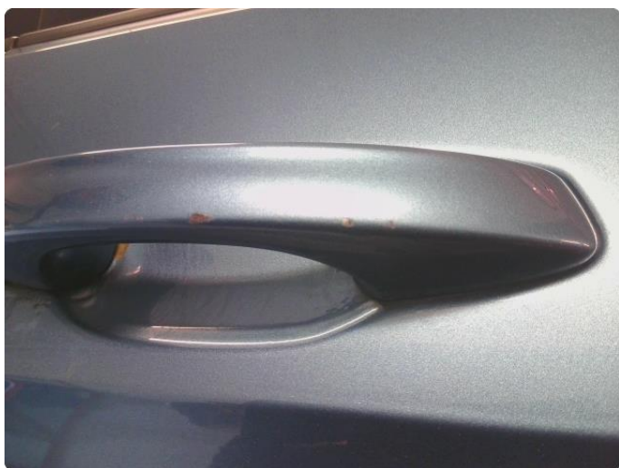
1.9 Håndtak lakkskadet/flasser