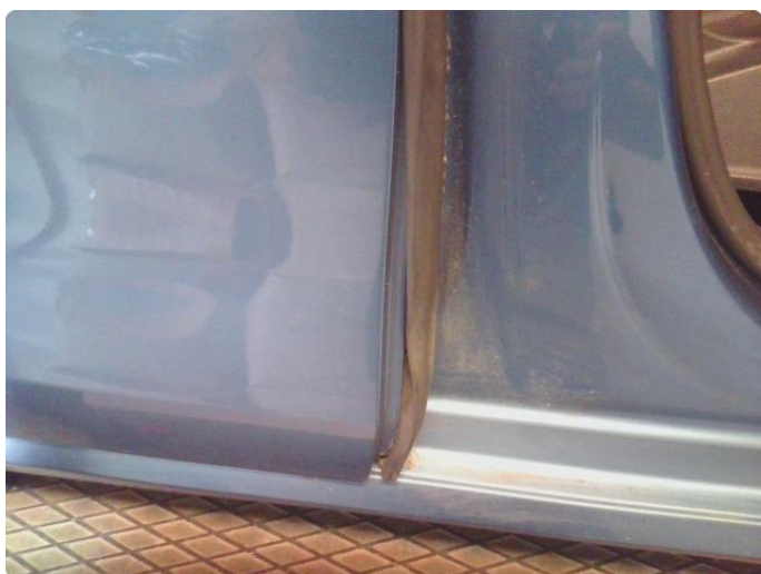
1.7 Løse/skadede lister