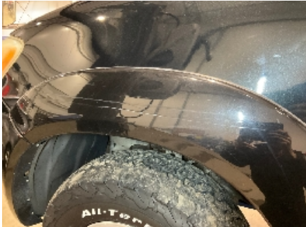
7. Lakk / karosseri utvendig