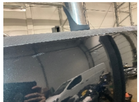
6. Lakk / karosseri utvendig