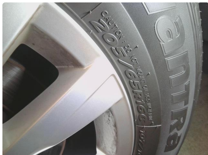
1.1 Dekkskade sommerhjul