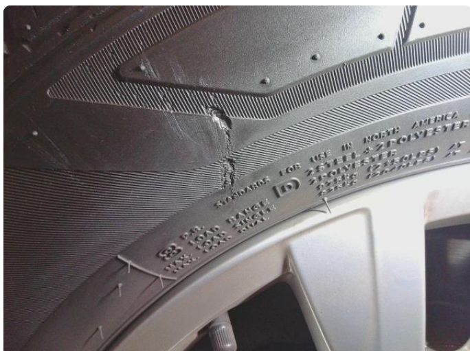
1.1 Dekkskade sommerhjul