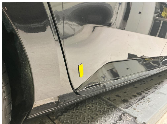
1.2 Løst nedre dørdeksel begge bakdører