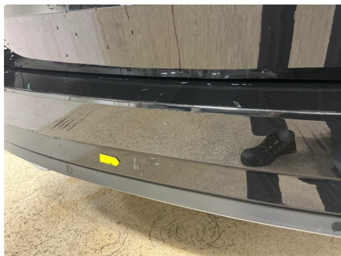
1.3 Lakksår og bult støtfanger bak, er penslet