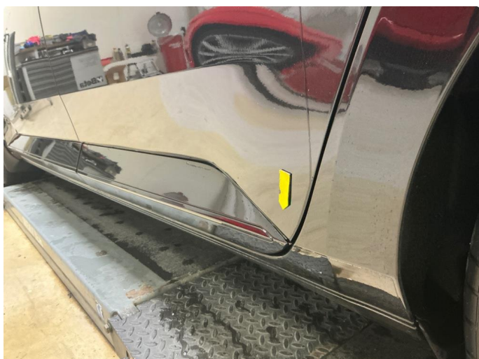
1.2 Løst nedre dørdeksel begge bakdører