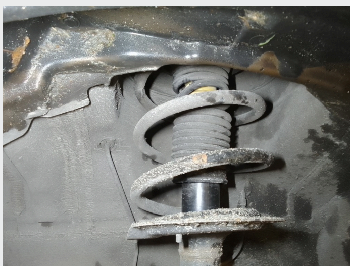
8.6 Revnet mansjetter støtdempere foran