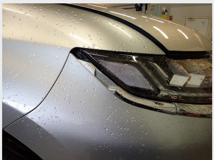
2.8 Knekt pyntelist ved lykt høyre foran