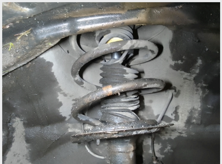
8.6 Revnet mansjetter støtdempere foran