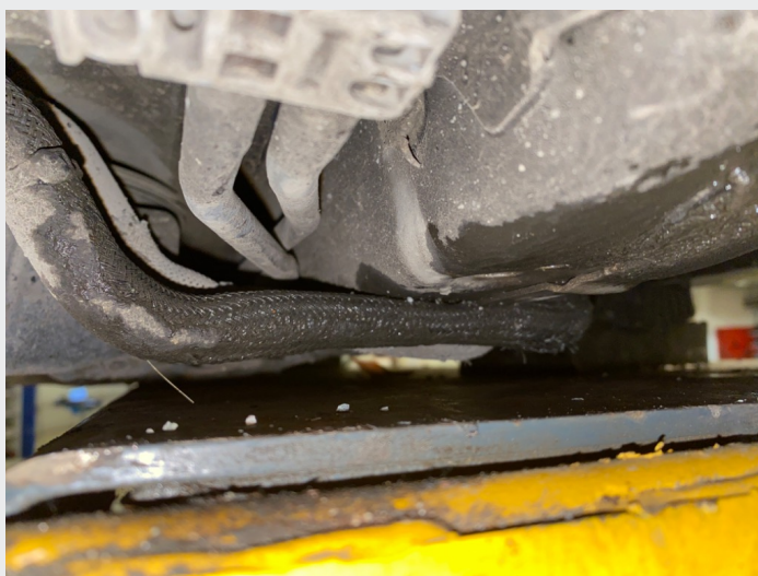
5.8 Klemt kjølerør foran ved batteri