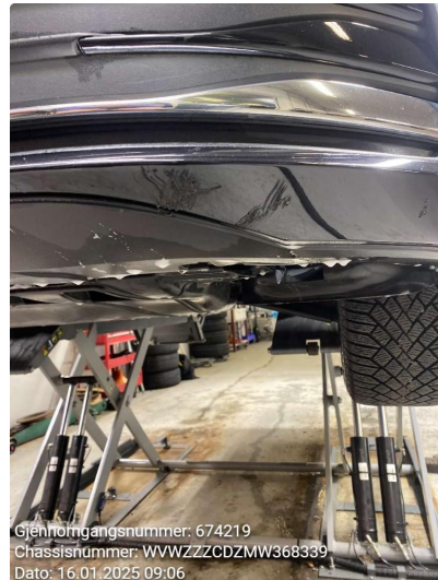
1.2 Skrubbskader underkant