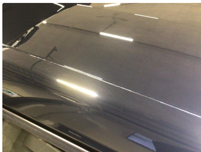
1.5 Små riper mellom B og C stolpe