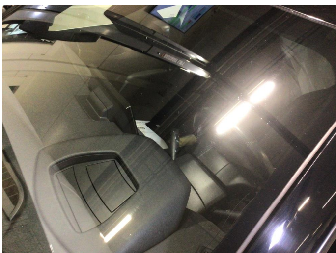
1.4 Minimalt med steinsprut på frontvindu