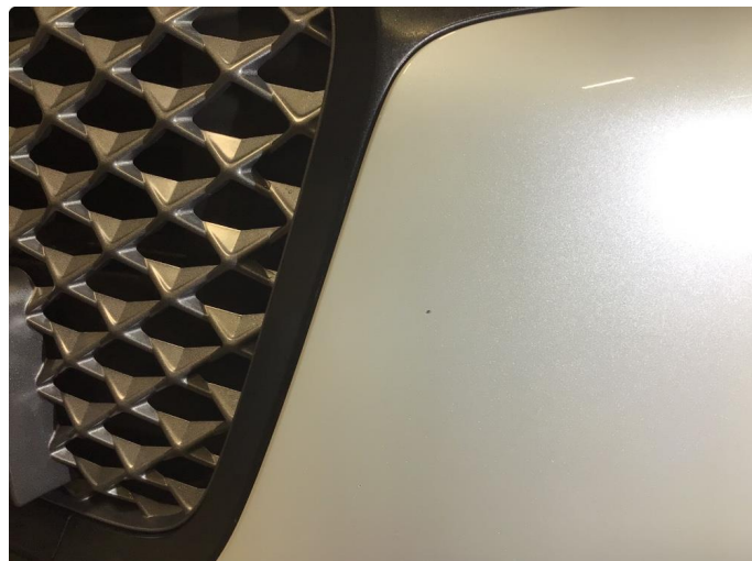
1.2 Liten steinsprut flekk på fanger venstre side utbedret med smart repair