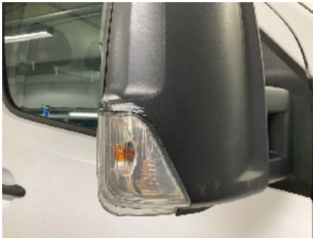
1. Utvendig speil