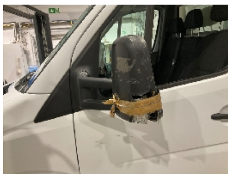
5. Utvendig speil