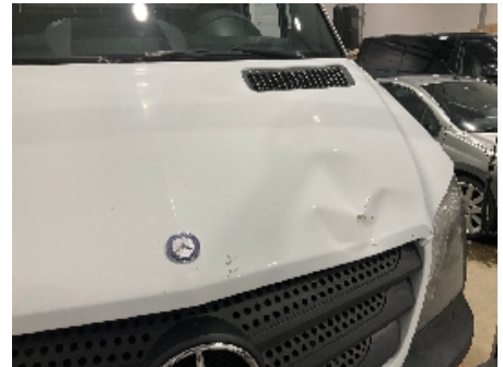
3. Lakk / karosseri utvendig