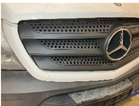
4. Lakk / karosseri utvendig