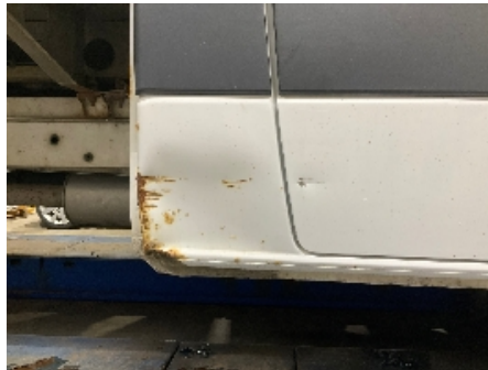
2. Lakk / karosseri utvendig