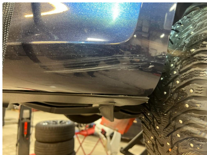
1.1 Skrubbskader underkant