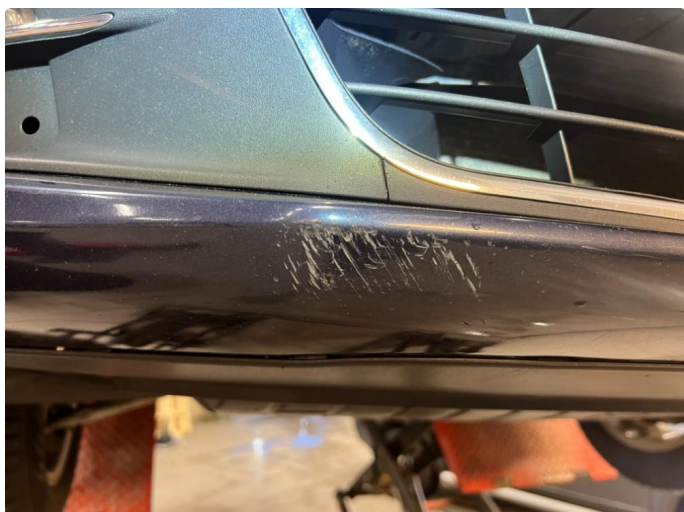
1.1 Skrubbskader underkant