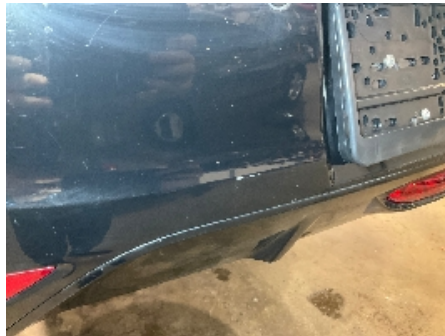
2. Lakk / karosseri utvendig