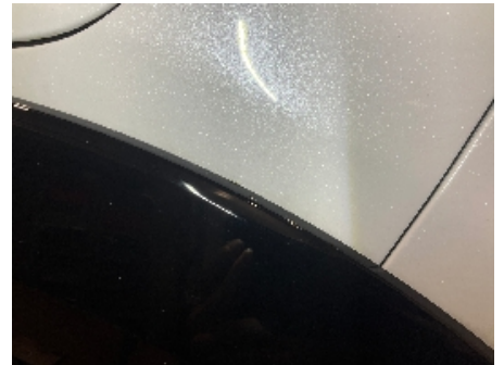
3. Lakk / karosseri utvendig