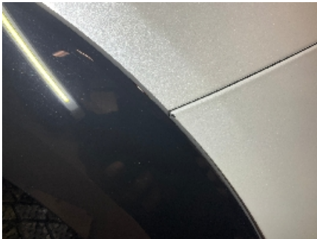
1. Lakk / karosseri utvendig