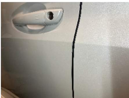
4. Lakk / karosseri utvendig