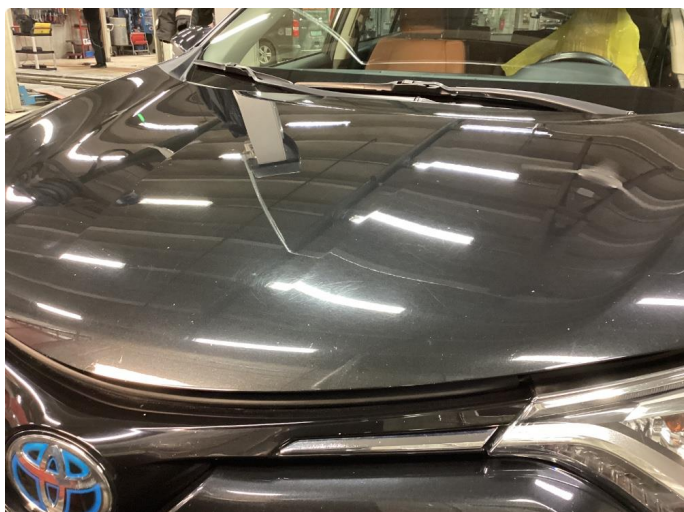
1.2 Steinsprut og riper