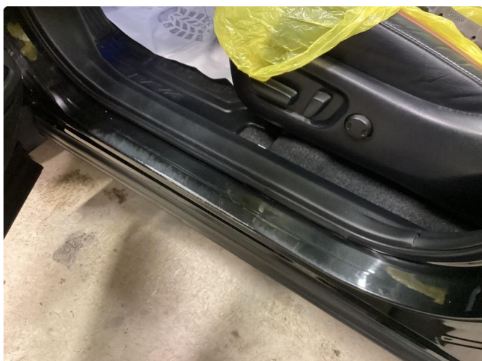
1.4 Dørkarm venstre foran