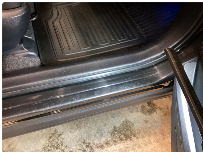
1.3 Dørkarm Høyre foran